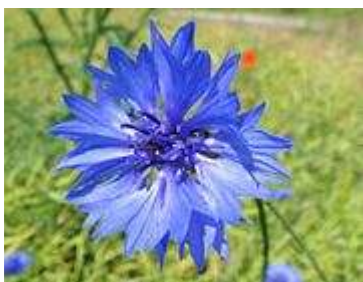
fiore di fiordaliso.

Gli antociani (dal greco anthos = fiore , kyáneos = blu ) o antocianine sono una classe di pigmenti idrosolubili appartenente alla famiglia dei flavonoidi . Le antocianine sono tra i più importanti gruppi di pigmenti presenti nei vegetali, e si ritrovano nei fiori e frutti così come negli arbusti e nelle foglie autunnali. Il colore delle antocianine può variare dal rosso al blu , dipende dal pH del mezzo in cui si trovano e dalla formazione di sali con metalli pesanti presenti in quei tessuti. Ad esempio, la cianina costituisce il colore di alcune dalie e del fiordaliso .